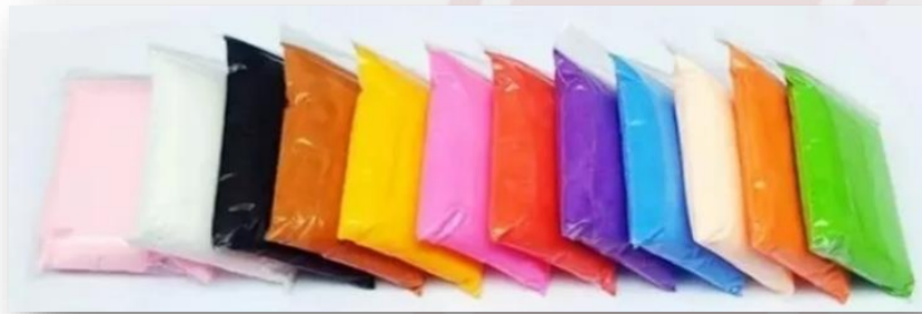
Foto de las bolsitas individuales de foami moldeable, ideales para este proyecto.

Conoce más sobre el material y el diario visual en modelado, leyendo y observando sobre el proyecto “¿Cómo amaneciste hoy?”, haciendo clic en este enlace .